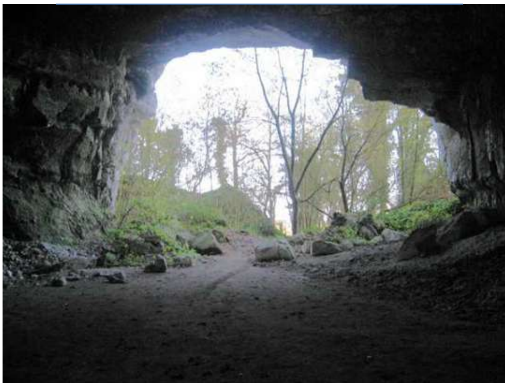
Carrières de Caumont. Entrée «Pré aux Vaches »